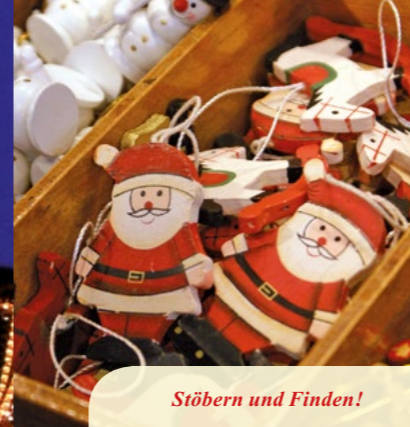
Stöbern und Finden!

★ Live-Musik zum Advent: In der kleinen Budenstadt auf dem Gänsemarkt wird in der Adventszeit ab und zu Live-Musik aus Europa, Afrika und Südamerika geboten. Öffnungszeiten: 23. November bis 23. Dezember jeweils 11 Uhr bis 21 Uhr, freitags und sonntags bis 22 Uhr. Anfahrt: U2 bis Haltestelle Gänsemarkt. K. Karkmann © SeMa