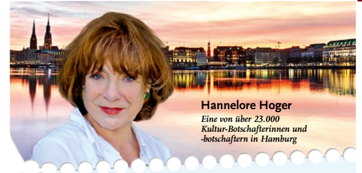
Hannelore Hoger Eine von über 23.000 Kultur-Botschafterinnen und -botschaftern in Hamburg

Kontakt Daten: www.inkultur.de , Tel. 040/227 00 666