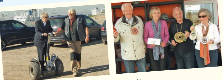
Ziesel-Cup in der Hafencity Die Senioren der Seniorenresidenz Alsterpark der Vereinigten Hamburger Wohnungsbaugenossenschaften eG sind flott unterwegs.