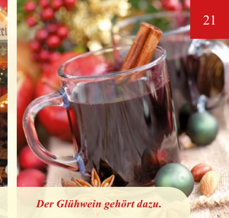
Der Glühwein gehört dazu.