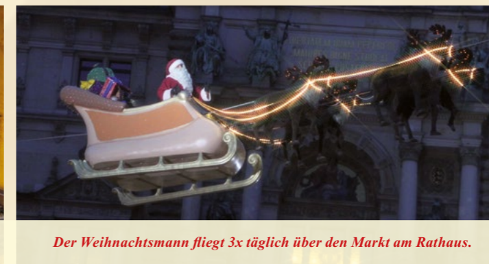
Der Weihnachtsmann fliegt 3x täglich über den Markt am Rathaus.