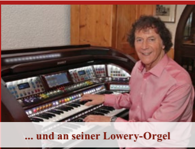
... und an seiner Lowery-Organ