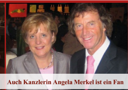
Auch Kanzlerin Angela Merkel ist ein Fan