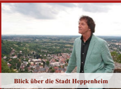
Blick über die Stadt Heppenheim