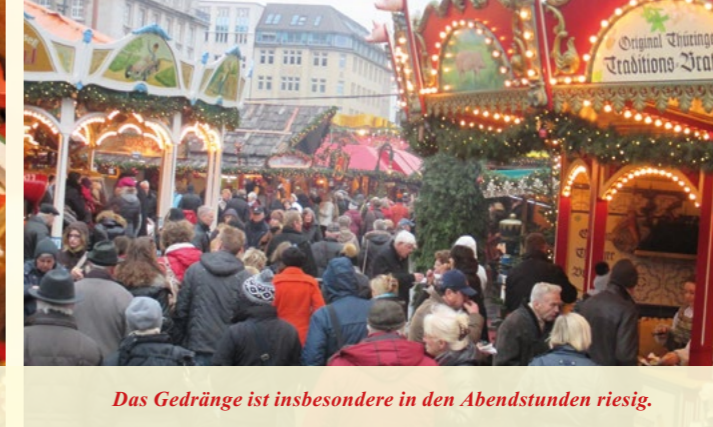
Das Gedränge ist insbesondere in den Abendstunden riesig.