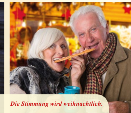
Die Stimmung wird weihnachtlich.